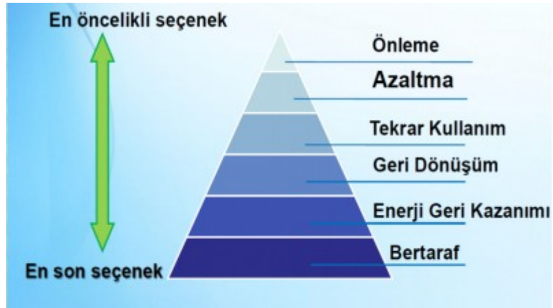
Görsel 3.4.1: Atık Piramidi

Atıklarımızı Atık Yönetimi Hiyerarşisi (Atık Piramidi)'ne göre yönetiriz.