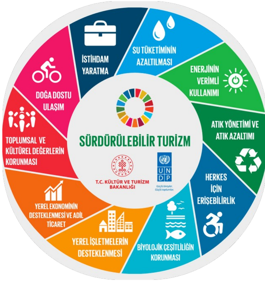
Görsel 3.2.1: Sürdürülebilirlik Hedefleri