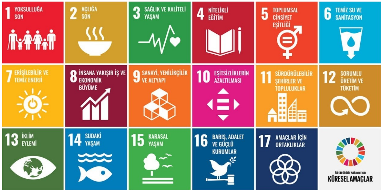
Görsel 1.1.1: Sürdürülebilirlik Kalkınma için Küresel Amaçlar

Sürdürülebilir Turizm; Birleşmiş Milletler Dünya Turizm Örgütü (UNWTO) tarafından “mevcut ve gelecekteki ekonomik, sosyal ve çevresel etkileri tam olarak hesaba katan; ziyaretçilerin, endüstrinin, çevrenin ve ev sahibi toplulukların ihtiyaçlarını karşılayan turizm” olarak tanımlanıyor.