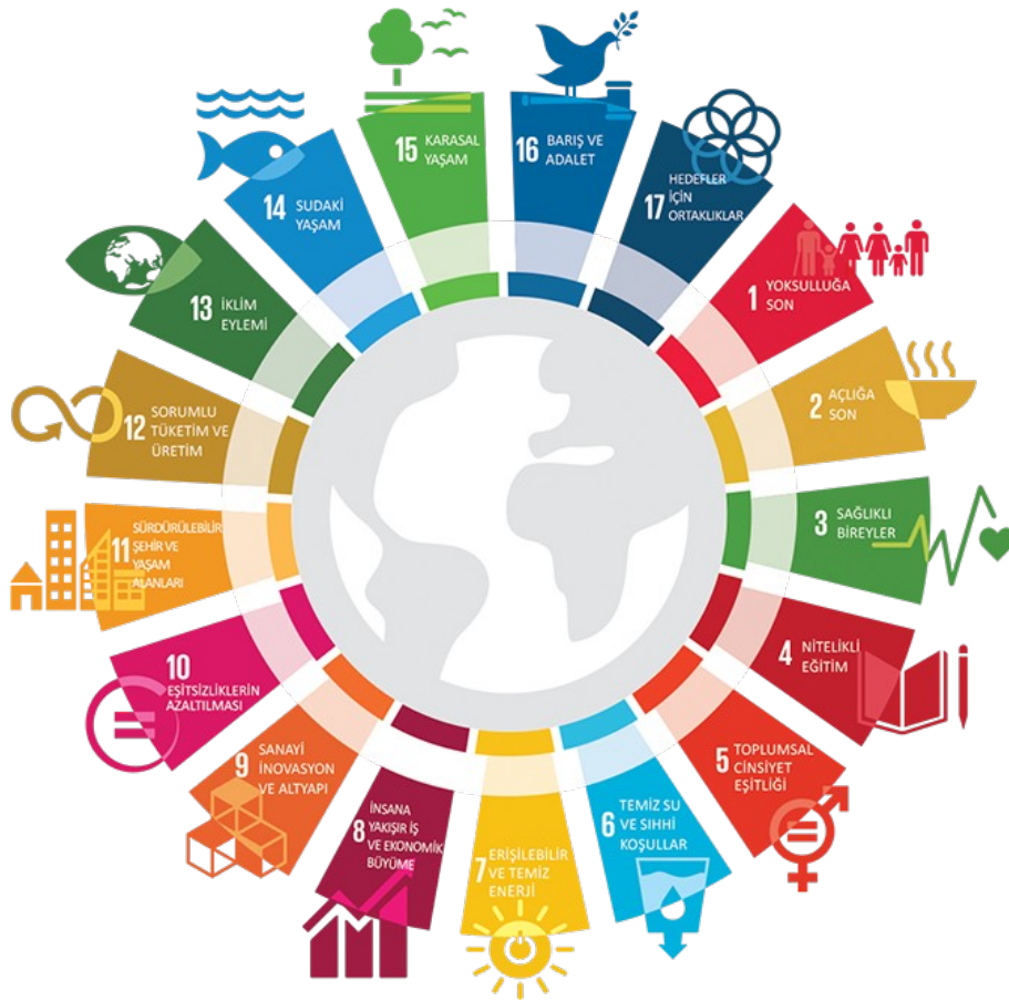
Görsel 3.1: Sürdürülebilirlik Ana Başlıkları

İrk, cinsiyet, engellilik gibi konularda ayrımcılığa fırsat vermeden, savunmasız grupların istismarının önlenmesi için çalışmayı, ücret ve hizmet kalitesinin artırılması da dâhil olmak üzere turizm tarafından yaratılan yerel istihdamın sayısını ve kalitesini arttırmayı hedeflemektedir.